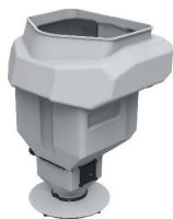
45L műtrágya tartály