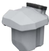
30L permetező tartály